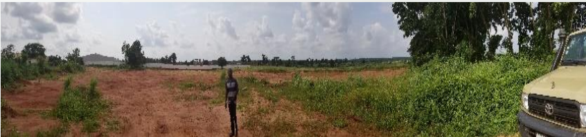
Highway-N1 stretch in front of site

Total Industrial Area available for development 400.78 Ha